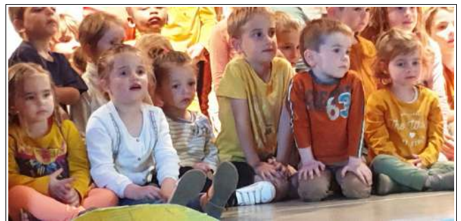
Ci-dessus : En attendant son tour...