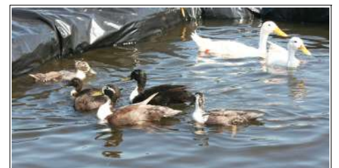
Ci-contre, au lendemain de la fête : les bénévoles venus remettre en ordre, défaire, ranger et ranger encore...